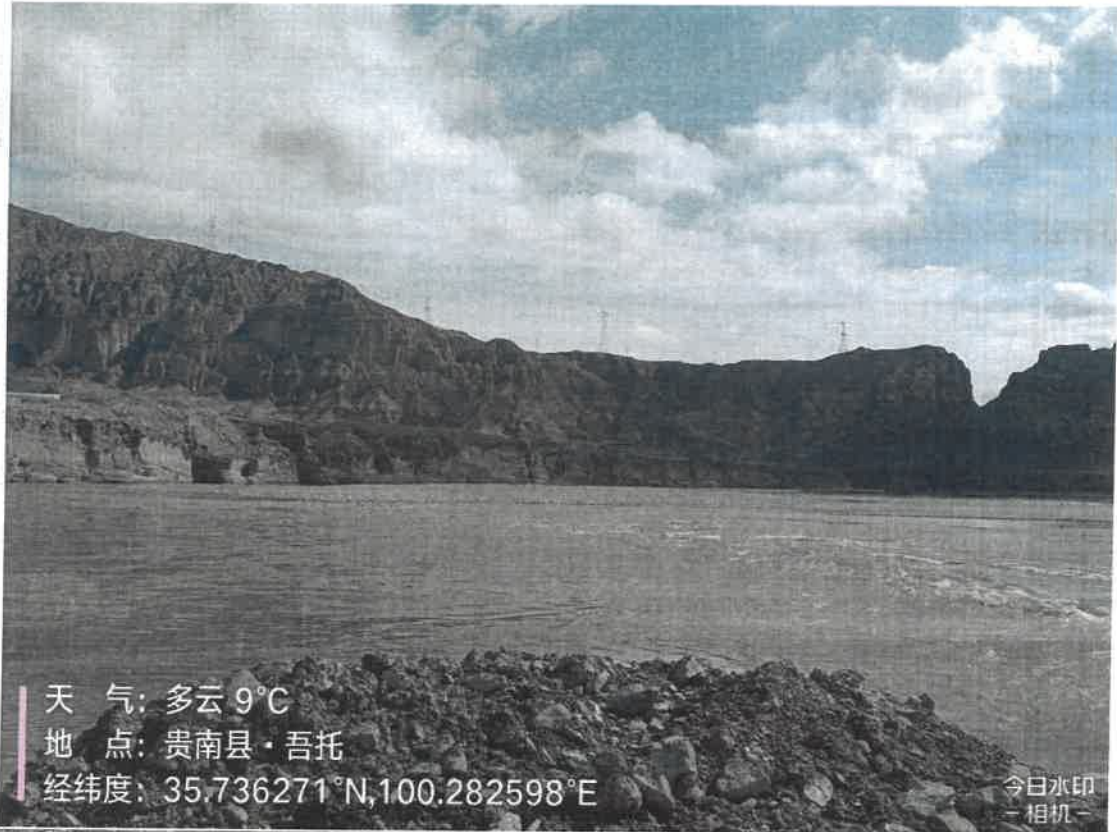
附件：羊曲电站地表水点位示意图