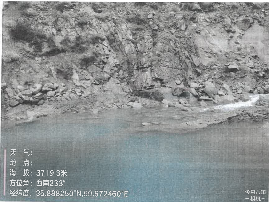
附件：5月份黄清河采样照片