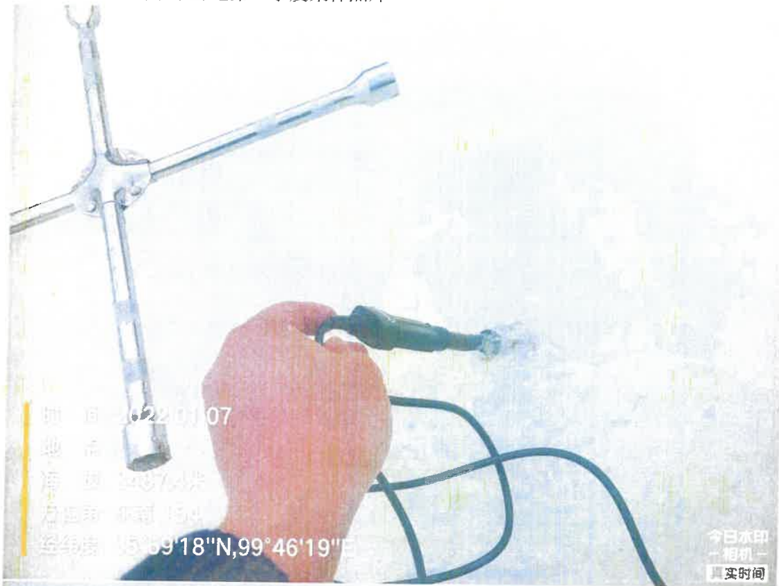
附件：兴海县河卡水源地第一季度采样照片