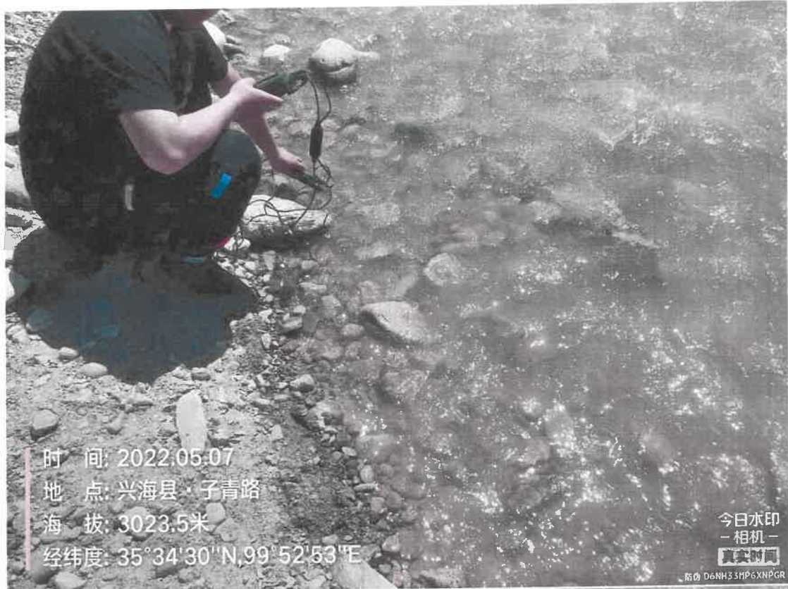
附件：5月份大河坝采样示意图