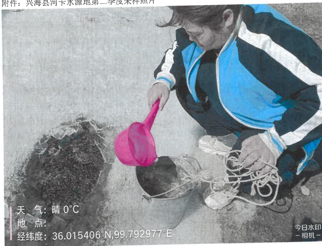
附件：兴海县河卡水源地第二季度采样照片