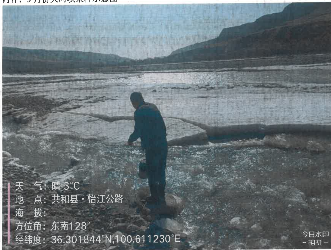
附件：3月份大河坝采样示意图