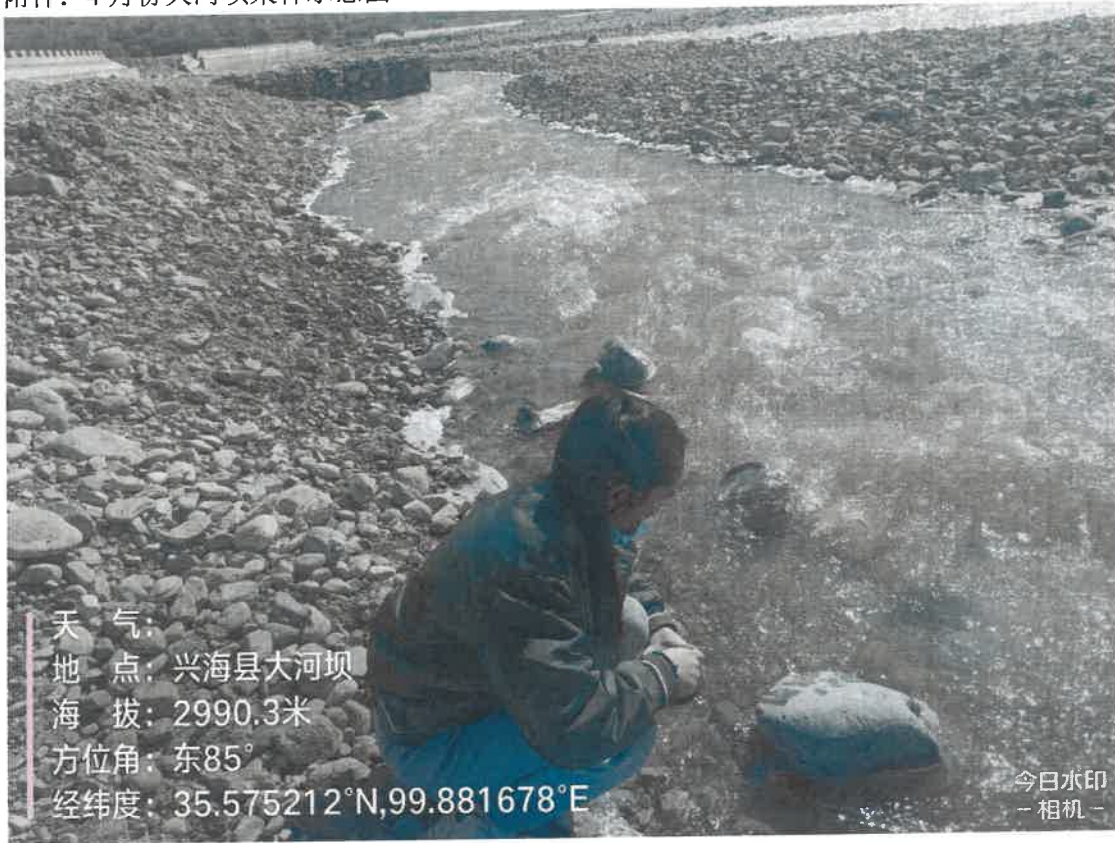
附件：4月份大河坝采样示意图