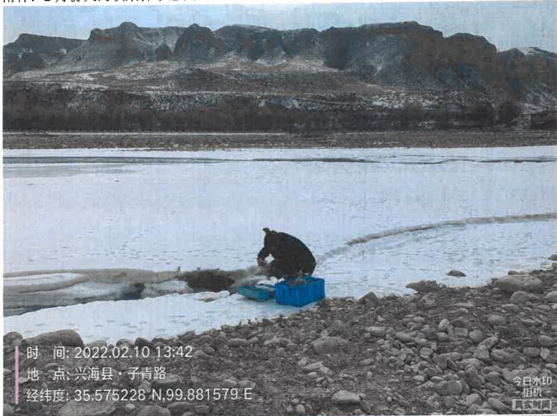
附件：2月份大河坝采样示意图