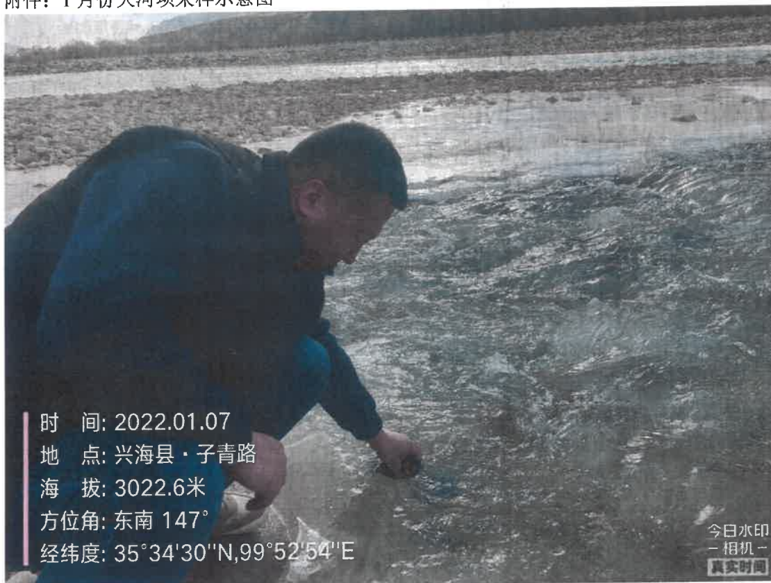
附件：1 月份大河坝采样示意图