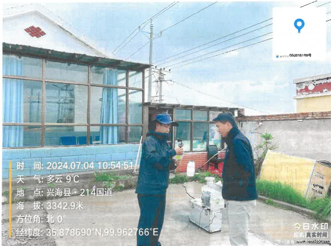
附件：兴海县都台村采样照片