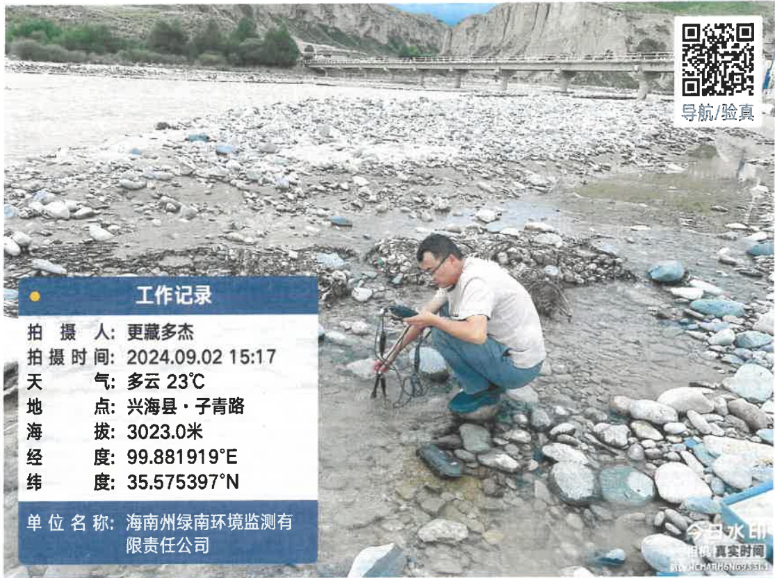
附件：兴海县大河坝 9 月份采样照片