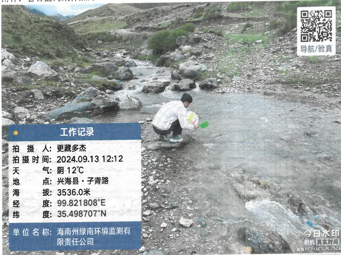
附件：智合盖沟采样照片