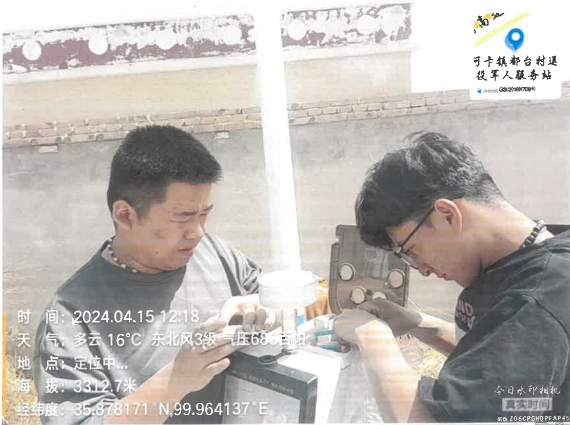
附件：兴海县都台村采样照片