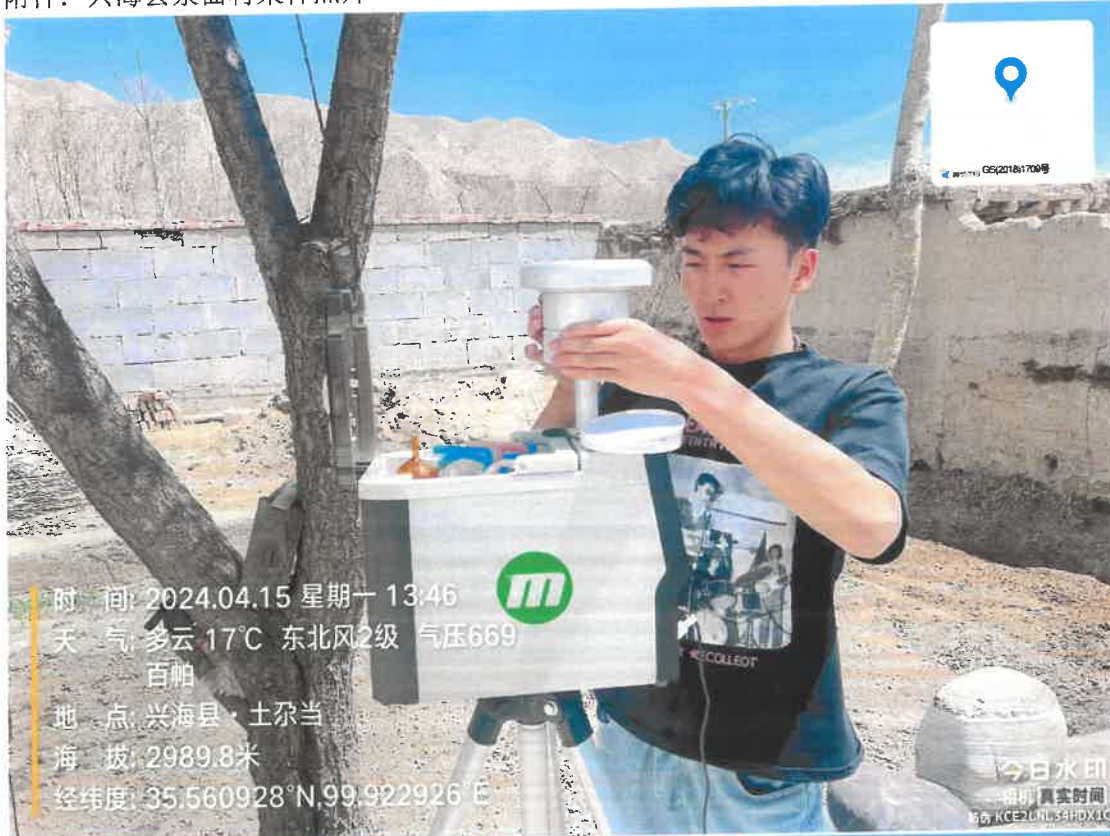
附件：兴海县泉曲村采样照片