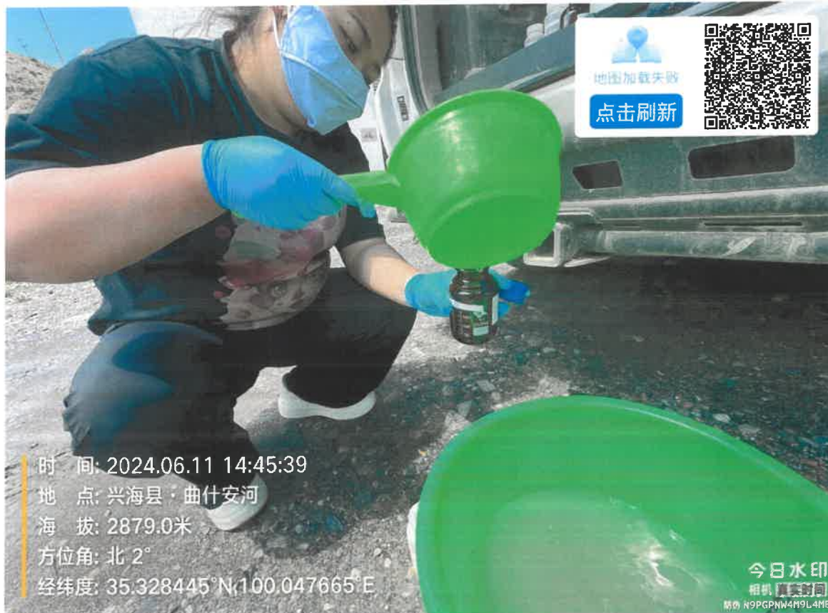
附件：党村水电站采样照片