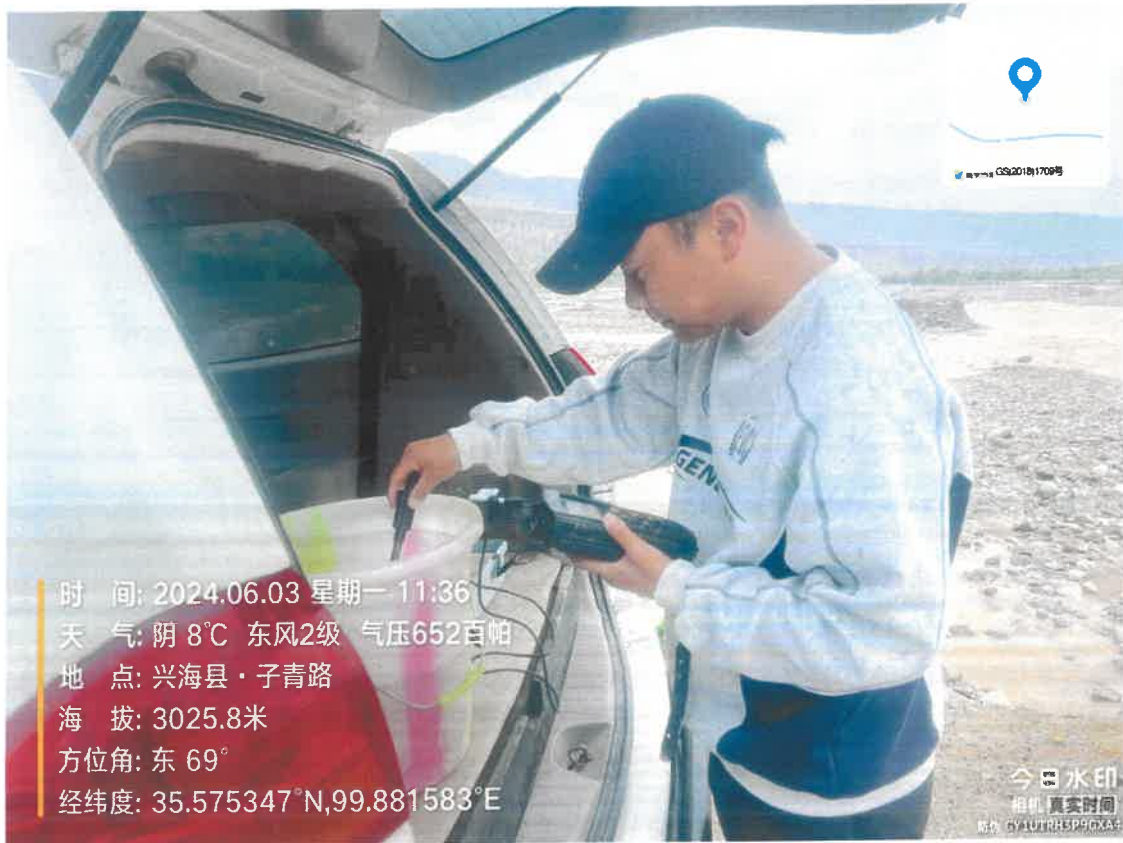
附件：兴海县大河坝 6 月份采样照片