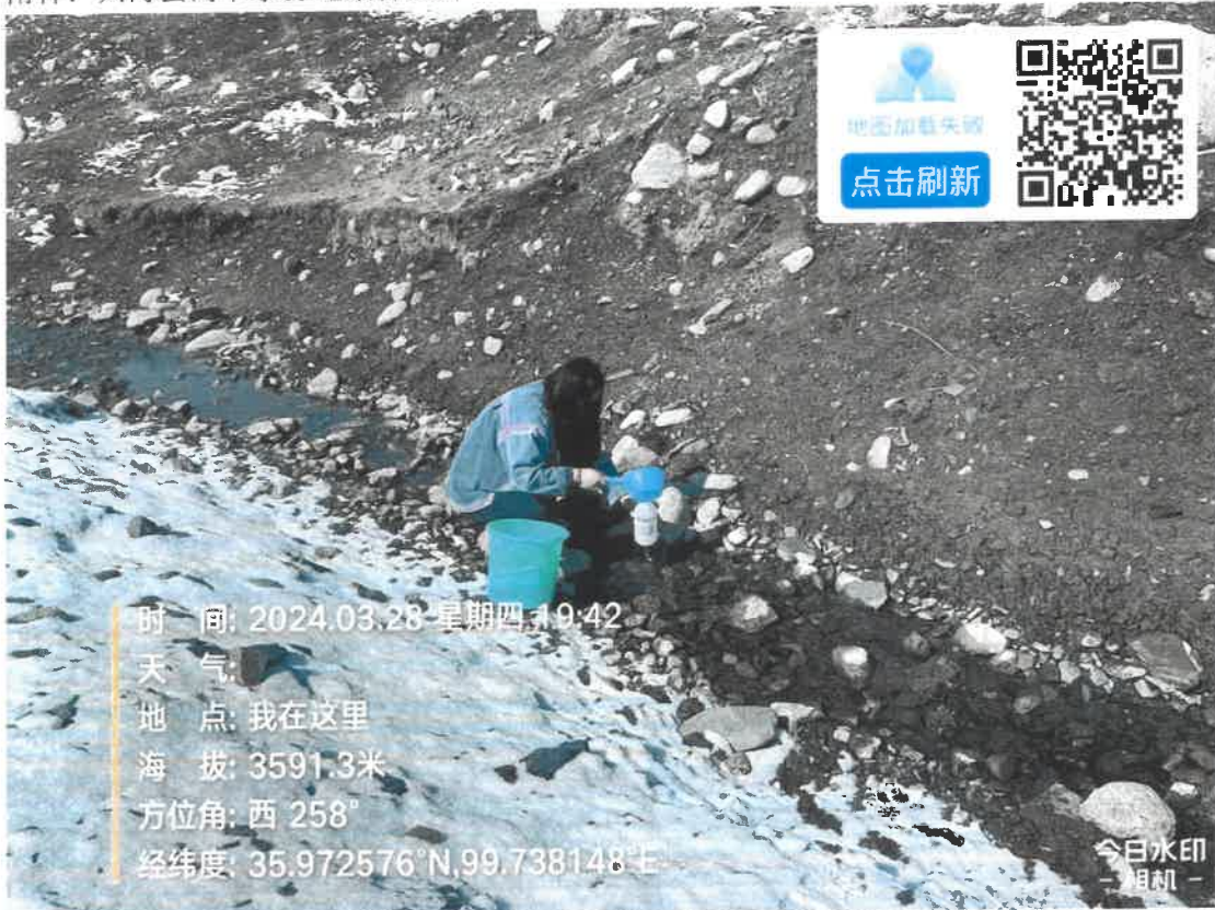
附件：兴海县河卡水源地采样照片